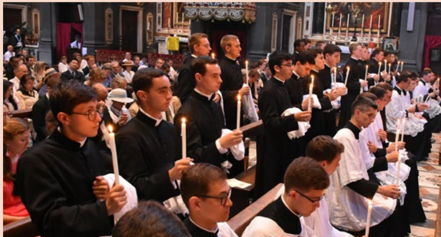
Appel des futurs tonsurés