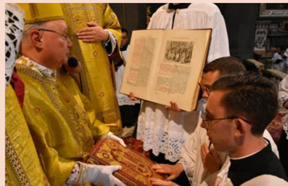
Ordination des exorcistes par S. Exc. R. M gr Provost, évêque de Lake Charles en Louisiane (États-Unis)