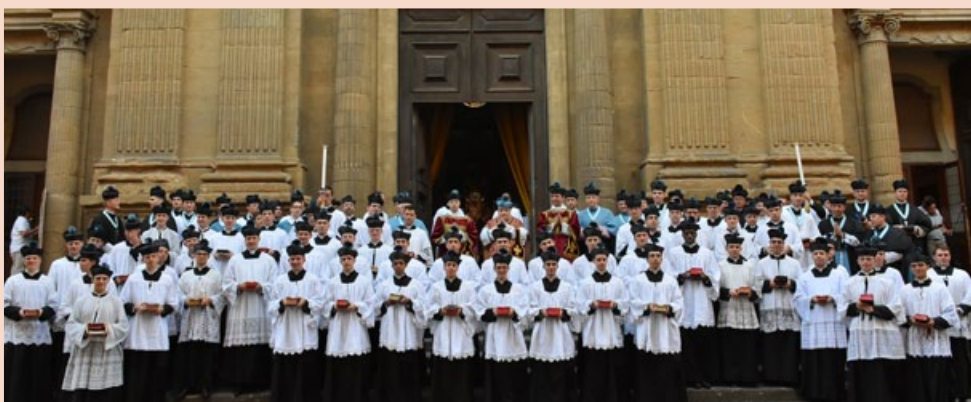
Les nouveaux tonsurés entourés par leurs confrères