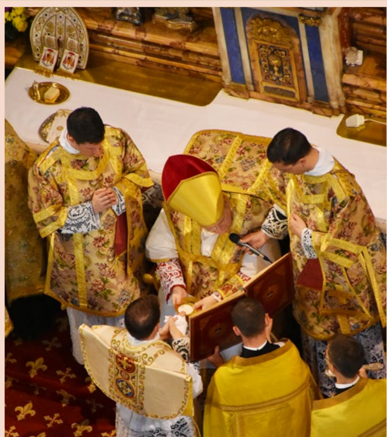
Ordinations sacerdotales par S.E.R. le Cardinal Burke