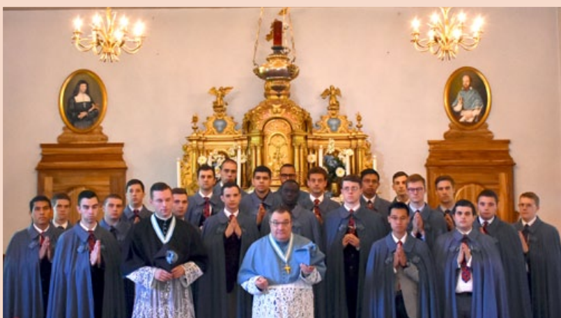
Retraite de rentrée pour les nouveaux séminaristes

Mais au fond, l'été n'est-il pas là pour bien préparer la rentrée ? Et qui dit rentrée, dit très nombreux nouveaux visages ! La Divine Providence nous