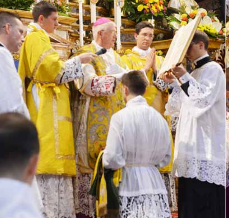
Ordination des diacres