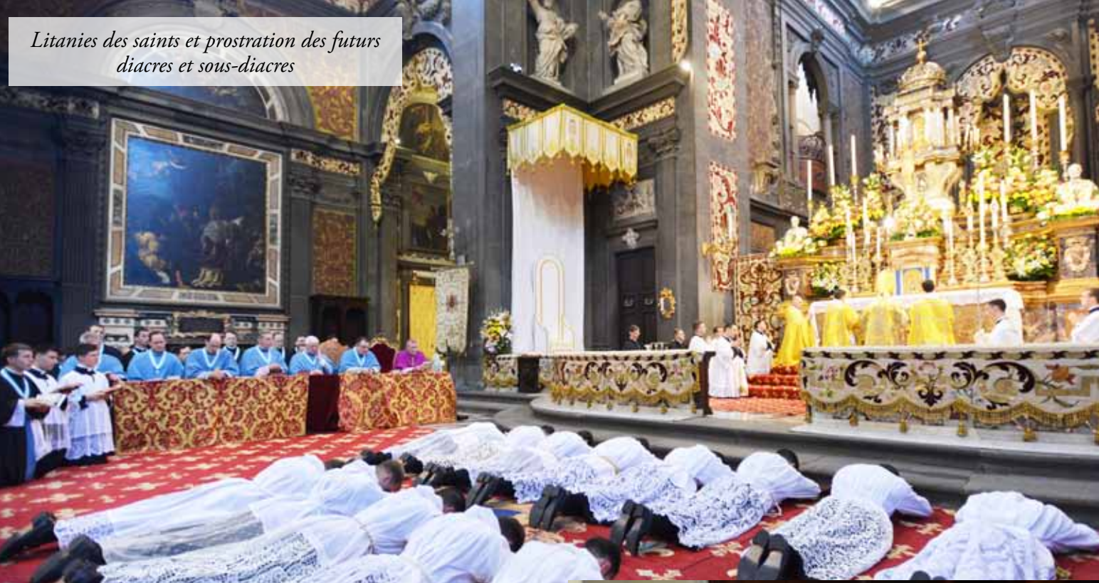
Litanies des saints et prostration des futurs diacres et sous-diacres