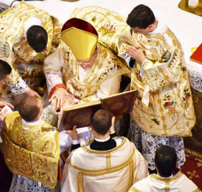
Consécration des mains d'un nouveau prêtre par S.E.R. le Cardinal Burke