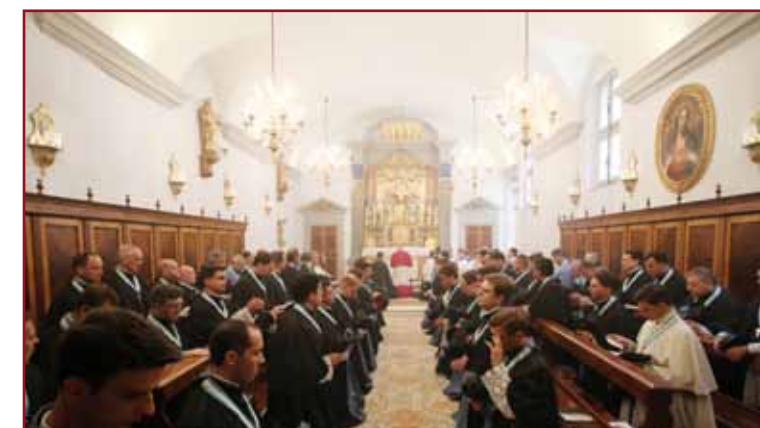
Messe pontificale célébrée par S.Exc.R. Mgr Schneider

Une sourde rumeur monte du séminaire de Gricigliano. En quelques heures, il est sorti de sa torpeur estivale et bourdonne d'une fiévreuse activité : le chapitre général vient de commencer ! Plus de cent chanoines venus des quatre coins du globe se sont réunis à la Maison-Mère, berceau de leur formation.