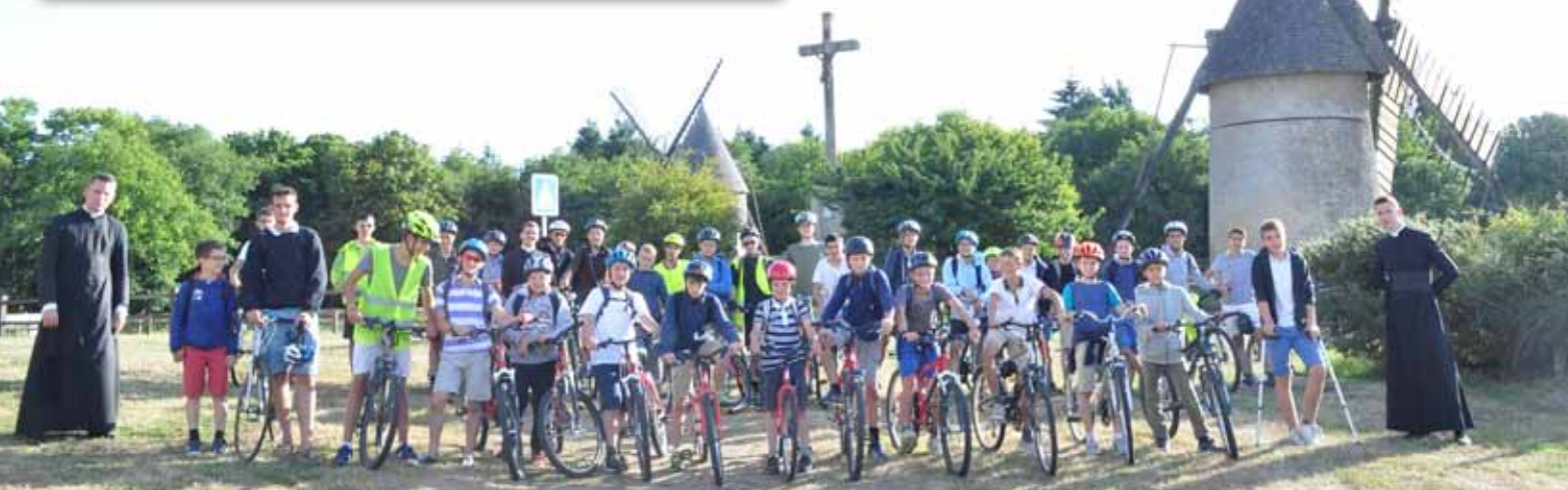
Le Camp vélo Saint-Joseph au sommet du Mont des Alouettes

Juillet ! Âgés de huit à trente ans, ils ont bouclé leur sac à dos et quitté leur famille pour passer deux semaines au grand air, sous le regard bienveillant du Bon Dieu.