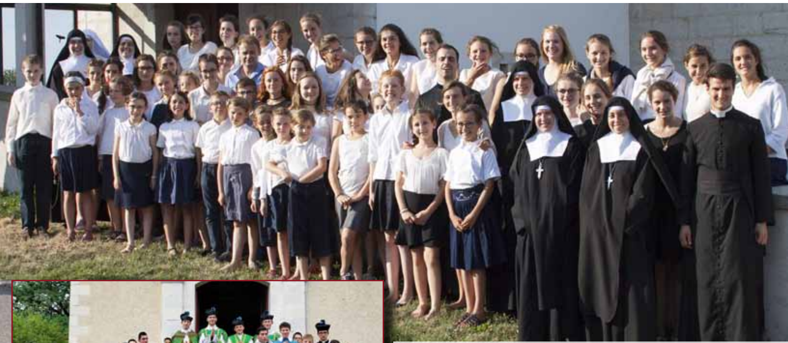
La colonie musicale Sainte-Cécile le soir de son concert