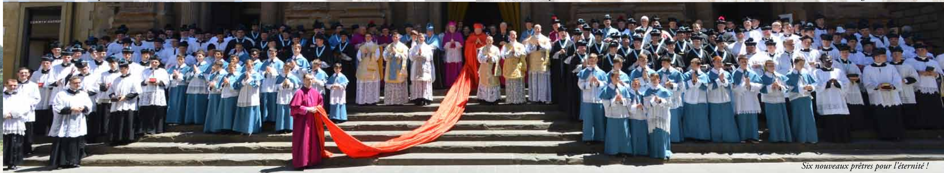
Six nouveaux prêtres pour l'éternité !