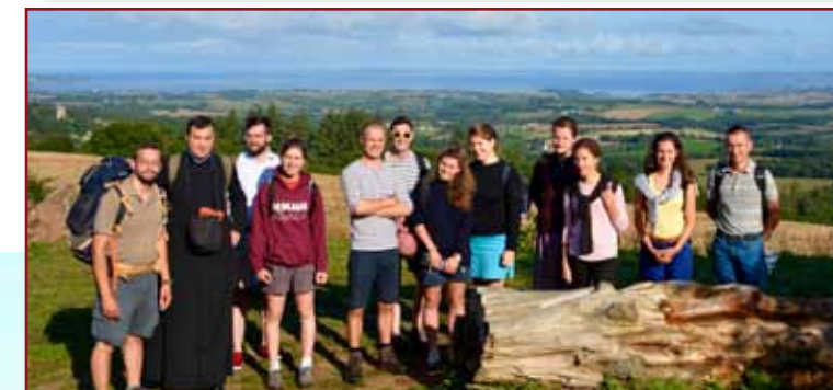
Première édition de la Marche des sept saints en Bretagne