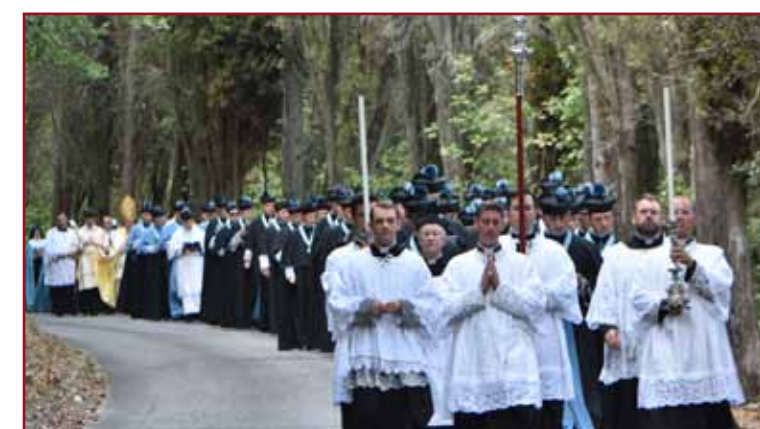
Procession jusqu'à la Maison des sœurs Adoratrices