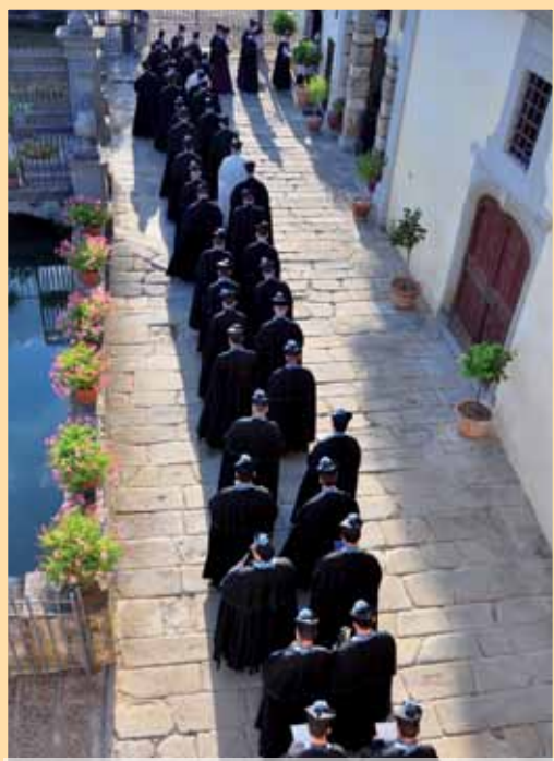
Procession des chanoines.

L e mois d'août à Gricigliano se conclut par une affluence de chanoines venus du monde entier à l'occasion du chapitre général de l'Institut. Durant cinq jours, le programme est bien rempli : Messes privées, conférences, Messe solennelle avec prédication, repas au réfectoire avec lecture, saluts du Saint-Sacrement, chant des vêpres et des complies, sans oublier les repas parlés du soir qui sont l'occasion de retrouver dans une ambiance chaleureuse les confrères vivant sur d'autres continents !