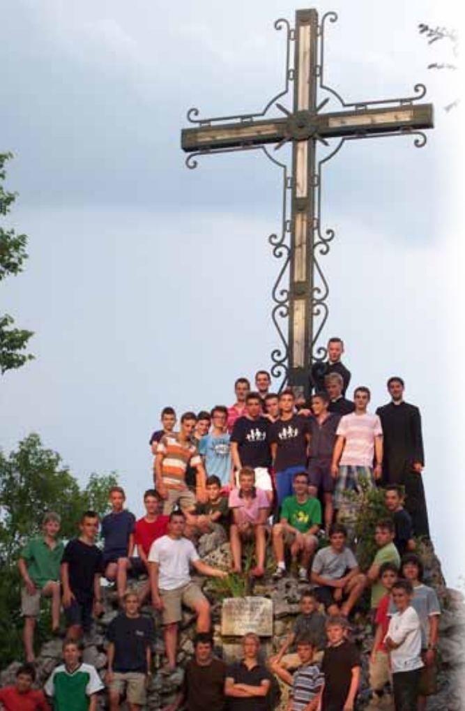
Le camp-vélo Saint-Joseph.

Les sœurs adoratrices accueillent de leur côté deux colonies pour les filles de 8 à 12 ans dans leur maison en Suisse.