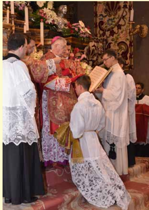
Imposition de la main lors de l'ordination diaconale. Ci-dessous, tous les prêtres imposent les mains après le Pontife, lors de l'ordination sacerdotale.