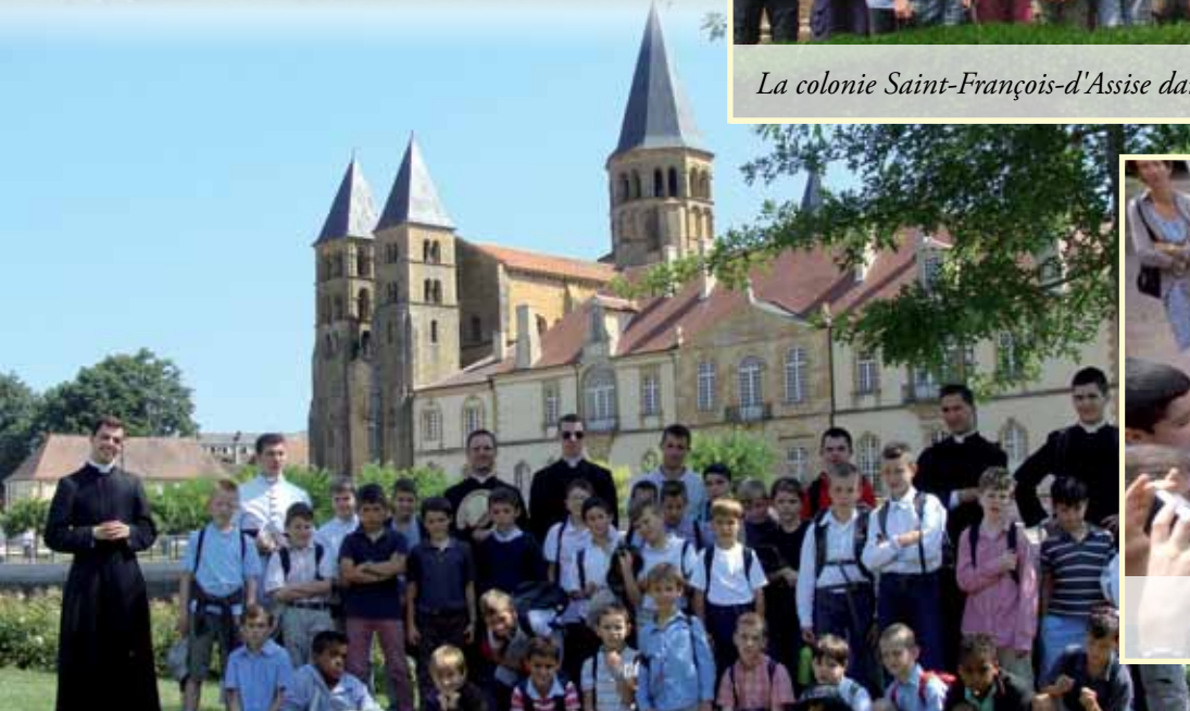
Photo-souvenir de la colonie Saint-Dominique-Savio, devant la basilique de Paray-le-Monial.