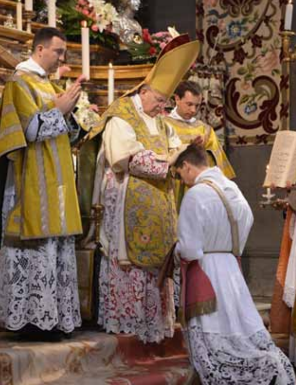
S.E.R. le Cardinal Burke imposant les mains aux nouveaux prêtres.