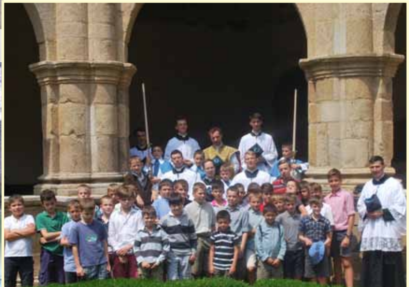
La colonie Saint-François-d'Assise dans le cloître de Sainte-Anne-d'Auray.