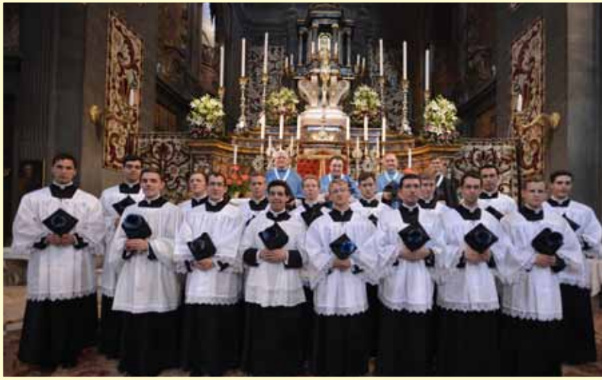
Les Supérieurs et les séminaristes ayant reçu la soutane. Ci-dessous, la chapelle du séminaire lors de la cérémonie de collation des ordres mineurs par S.Exc.R. Mgr Madega.