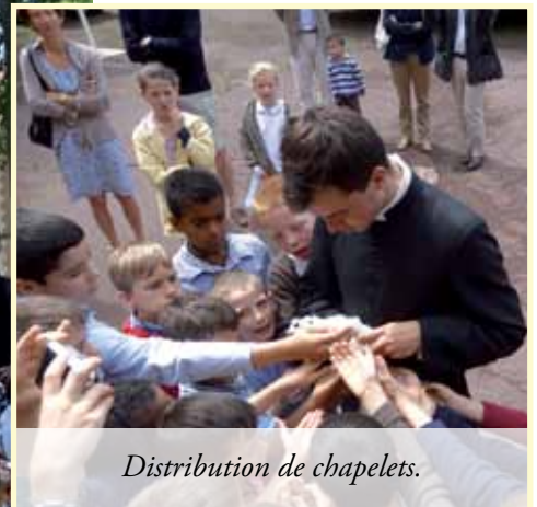
Distribution de chapelets.