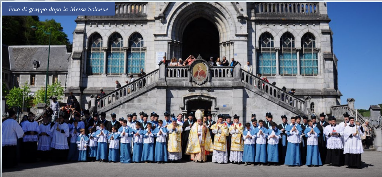
Foto di gruppo dopo la Messa Solenne

O Maria, concepita senza peccato, pregate per noi che ricorriamo a Voi!