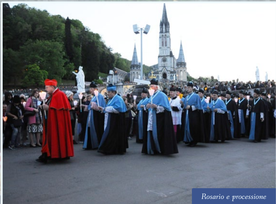
Rosario e processione