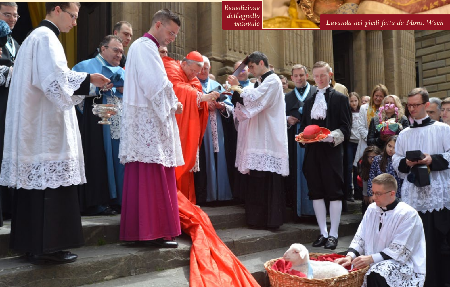
Benedizione dell'agnello pasquale