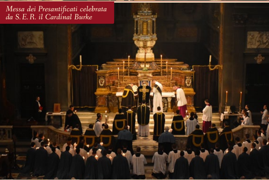
Messa dei Presantificati celebrata da S. E. R. il Cardinal Burke