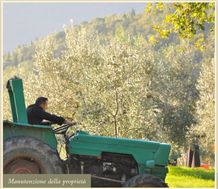
Manutenzione della proprietà