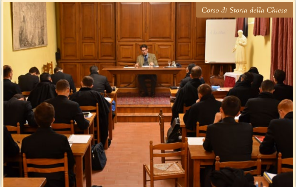
Corso di Storia della Chiesa

C ENTRO DELLA VITA del seminarista è la preghiera, unita agli studi ecclesiastici. Vi sono nel piano di studi lezioni regolari che costituiscono il nucleo della formazione intellettuale (Filosofia, Teologia, Spiritualità, Storia della Chiesa, Latino, Liturgia, ...), alle quali si aggiungono lezioni più specifiche su vari argomenti, sia storici che di attualità.