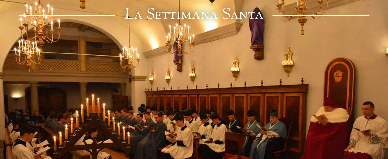
Officio delle Tenebre nella cappella del Seminario