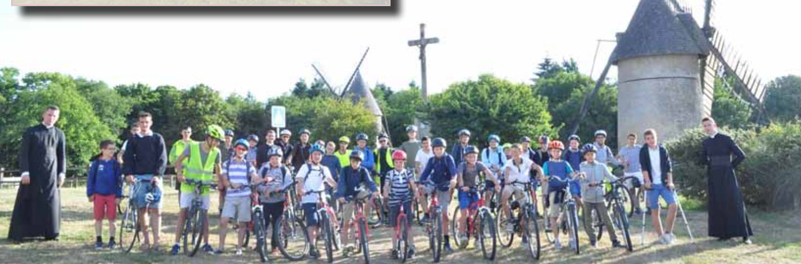
Le Camp vélo Saint-Joseph au sommet du Mont des Alouettes