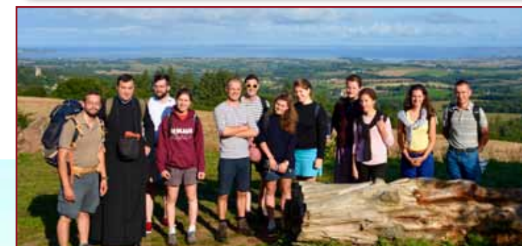
Première édition de la Marche des sept saints en Bretagne

Juillet ! Âgés de huit à trente ans, ils ont bouclé leur sac à dos et quitté leur famille pour passer deux semaines au grand air, sous le regard bienveillant du Bon Dieu.