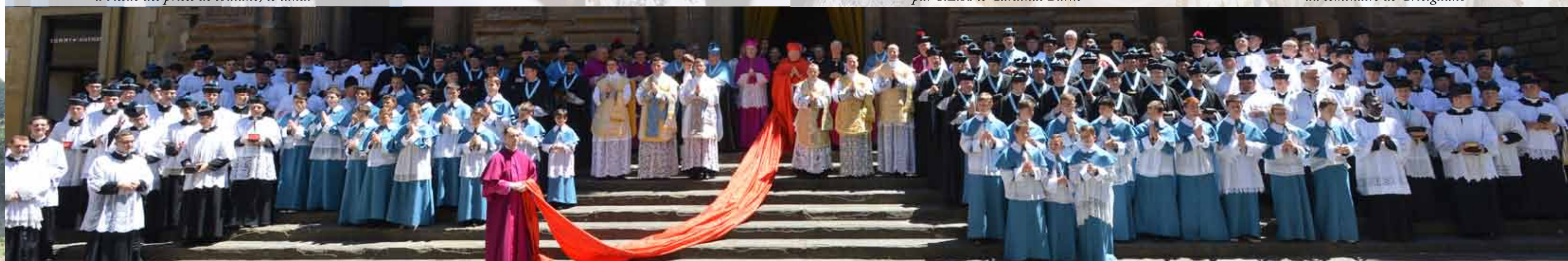
Six nouveaux prêtres pour l'éternité !