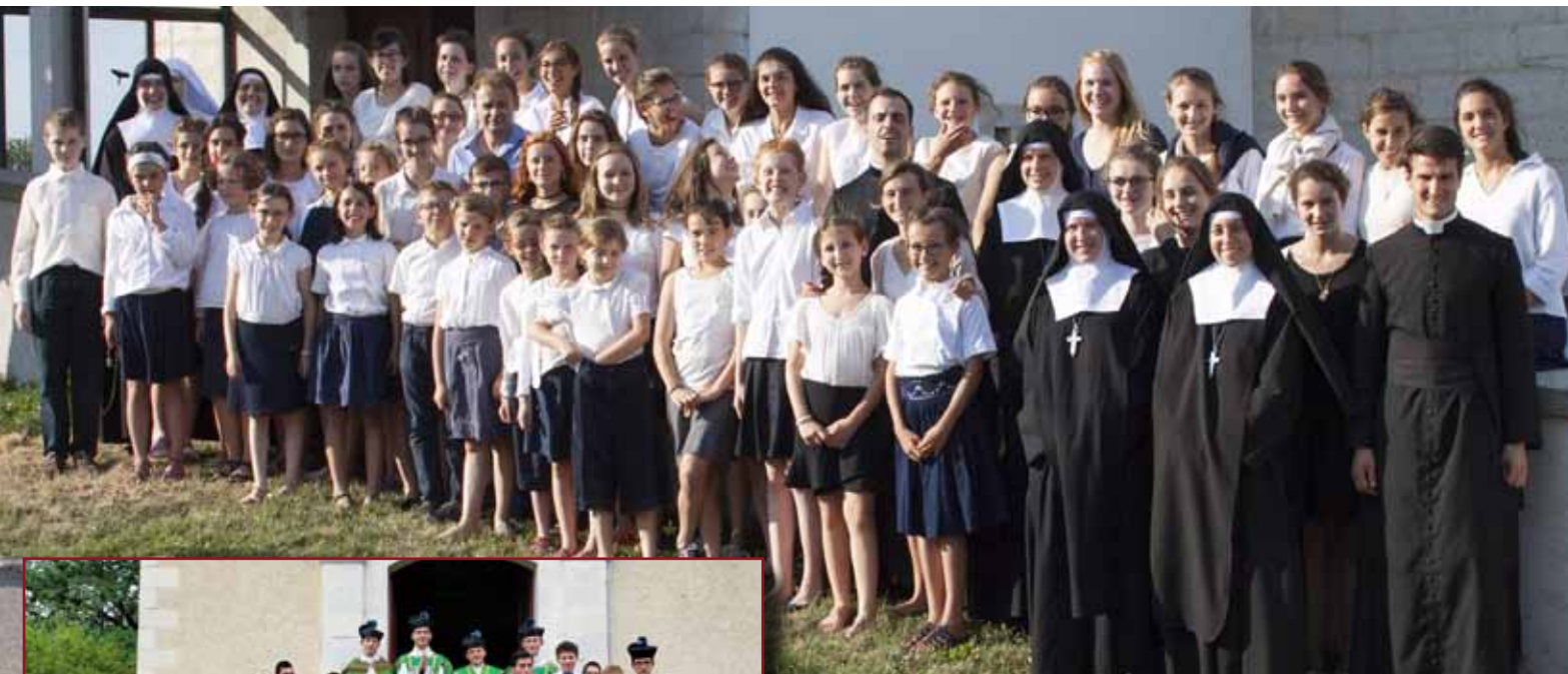
La colonie musicale Sainte-Cécile le soir de son concert