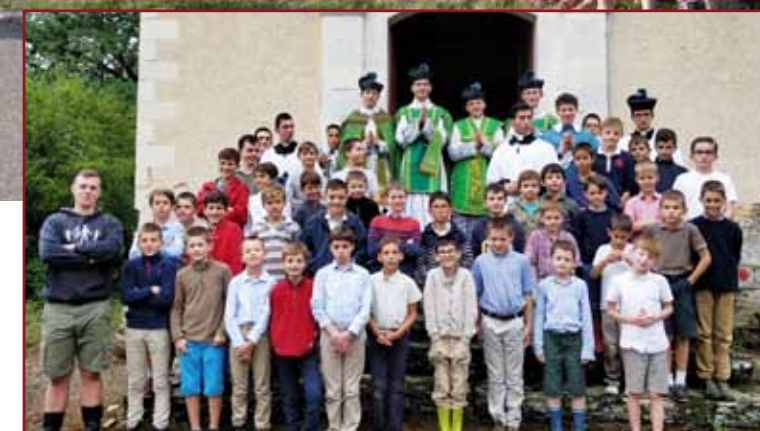
La colonie Saint-François-d'Assise à la sortie de la Messe