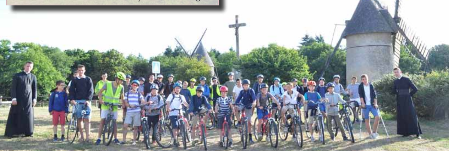
Le Camp vélo Saint-Joseph au sommet du Mont des Alouettes