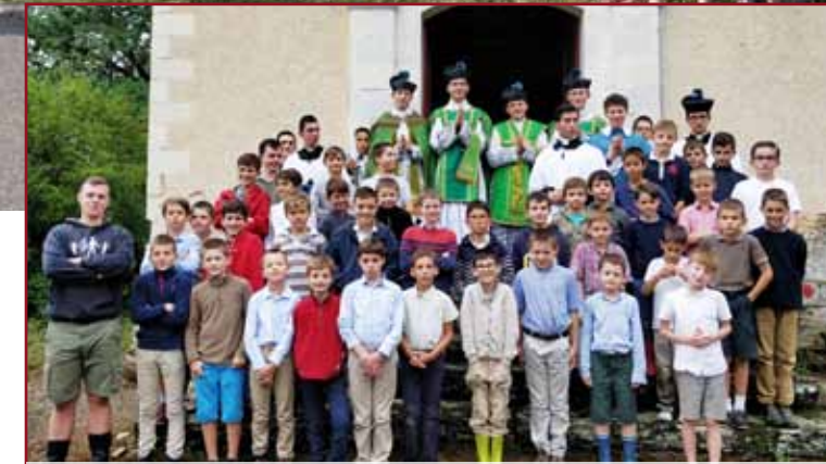
La colonie musicale Sainte-Cécile le soir de son concert

Juillet ! Âgés de huit à trente ans, ils ont bouclé leur sac à dos et quitté leur famille pour passer deux semaines au grand air, sous le regard bienveillant du Bon Dieu.