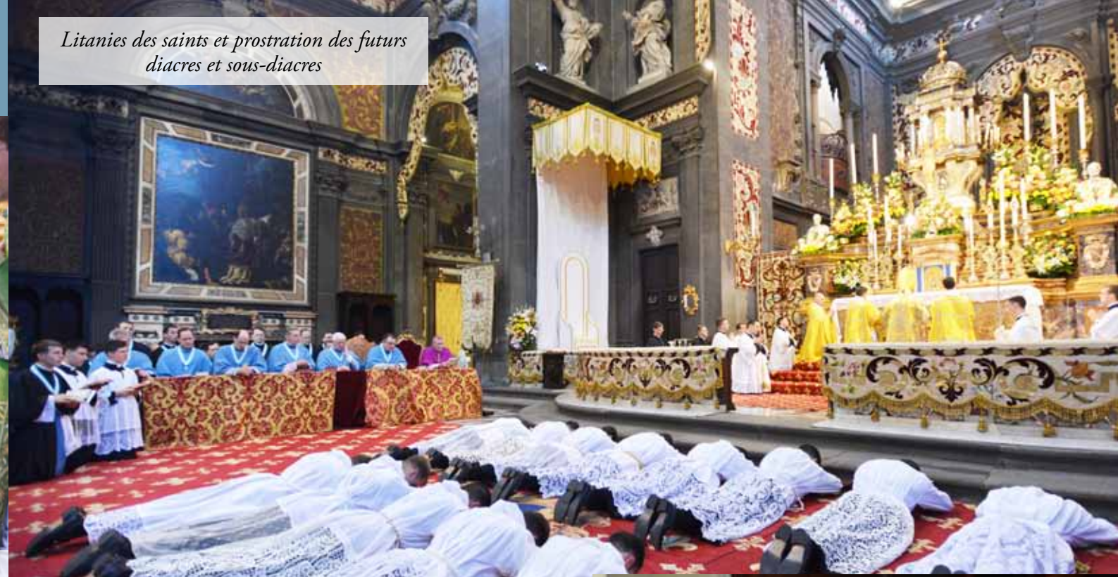
Litanies des saints et prostration des futurs diacres et sous-diacres