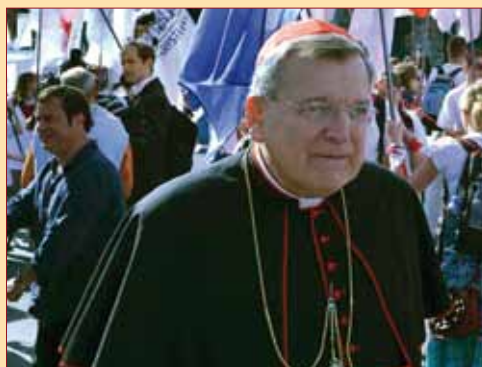
S. E. R. le Cardinal Burke lors de la Marche pour la Vie.