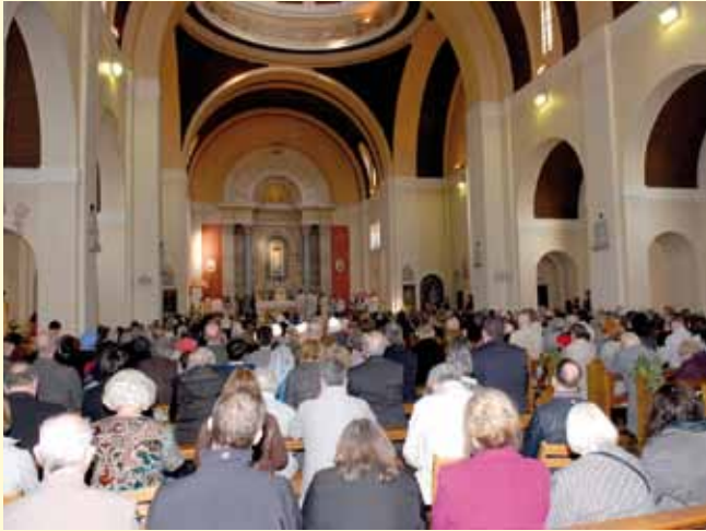
L'assistance était nombreuse...