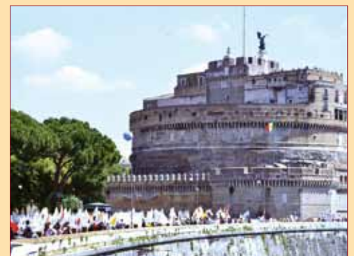
Le château Saint-Ange, terme de la Marche.