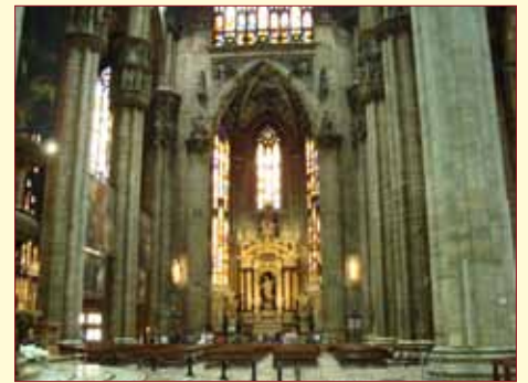
L'intérieur de la cathédrale.