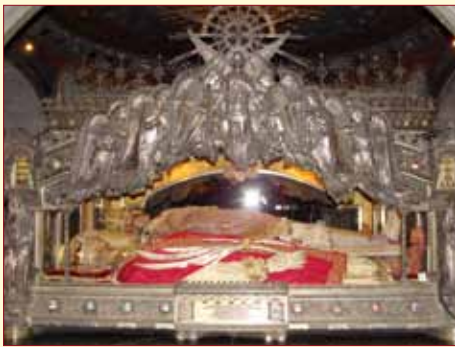
Saint Ambroise, Saint Gervais et Saint Protais.

Le lendemain matin, nous avons visité la basilique Saint-Ambroise où les corps de saint Ambroise et des saints Gervais et Protais, retrouvés au XIX e siècle sous le maître-autel, sont magnifiquement exposés dans une châsse en argent. Nous nous sommes aussi rendus au Duomo de Milan, l'une des cinq plus grandes églises du monde, dont la construction, commencée au XV e siècle, s'est achevée au XIX e siècle.