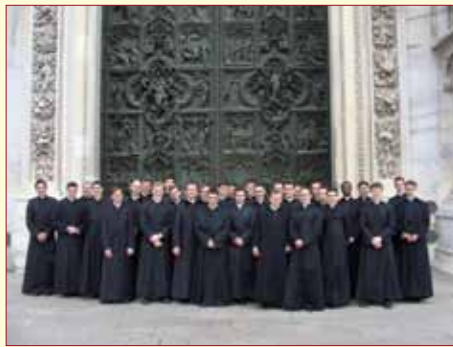
Les séminaristes devant la porte de bronze du Duomo.