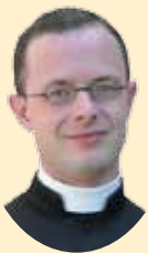
Abbé Alexis d'Abbadie d'Arrast (France)