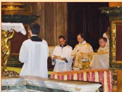
Le Salut du Saint-Sacrement donné à Sainte-Marie-Majeure.

Les 12 et 13 mai, des séminaristes se sont rendus à Rome, à l'occasion de la Marche pour la Vie qui, pour la première fois, avait lieu dans la Ville éternelle. Celle-ci a débuté par l'adoration du Saint-Sacrement exposé sur l'autel papal de la basilique Sainte-Marie-Majeure ; le Salut a été donné par S. E. R. le Cardinal Burke. Le lendemain, après avoir assisté à la Sainte Messe dans la basilique des Saints-Jean-et-Paul, nous avons marché avec des milliers de personnes et de nombreuses autorités religieuses et politiques, dont le Cardinal Burke et le maire de Rome.