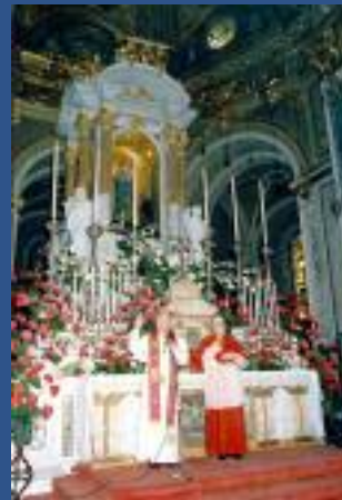
Visite de S.S. le Pape Jean-Paul II à Gênes.