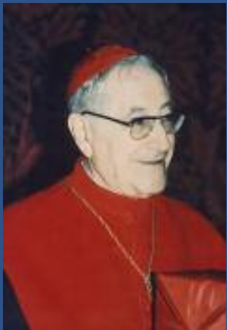
S.E.R. le Cardinal Joseph Siri ...