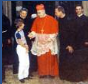
Conférence et visite pastorale.