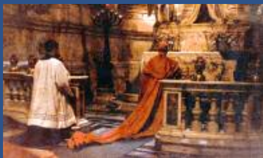
Cérémonies à la Cathédrale de Gênes.