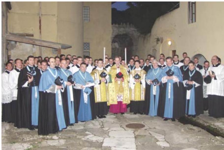
Monsignor Camille Perl (al centro della foto) Vice presidente della Pontificia Commissione Ecclesia Dei, a Gricigliano la sera del 7 ottobre 2008, dopo la promulgazione del decreto «Saeculorum Rex» che eleva l'Istituto di Cristo Re Sommo Sacerote al rango di Società di vita apostolica di Diritto pontificio in forma canonica.

Martedì 7 ottobre 2008, festa del santissimo Rosario, è una data storica per l'Istituto di Cristo Re Sommo Sacerdote: in questa data, infatti, col decreto Saeculorum Rex della Pontificia Commissione Ecclesia Dei , la Santa Sede ha canonicamente eretto l'Istituto al rango di Società di vita apostolica in forma canonica di Diritto pontificio. Per la promulgazione del decreto, giunse nel pomeriggio di martedì 7 Monsignor Camille Perl, vice presidente della Commissione Ecclesia Dei : Monsignor Perl, dopo aver dato pubblica lettura dei decreti concernenti l'Istituto di Cristo