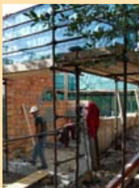
Septembre à novembre : trois mois de travaux