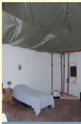
Certains plafonds s'effritent...

Merci d'avance et que Dieu vous bénisse !