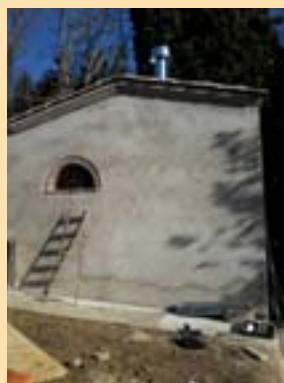
Décembre : la nouvelle chaufferie !