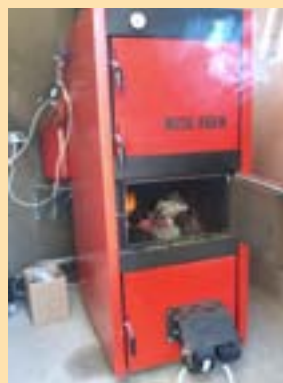
Le 22 décembre : la nouvelle chaudière !