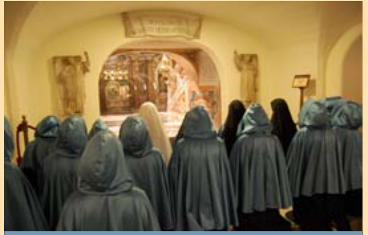
Dans la basilique Saint-Pierre de Rome : prière des postulantes devant la confession du Prince des Apôtres.

Les postulantes ont eu la grâce de pouvoir effectuer au mois de décembre dernier un pèlerinage dans la Ville Éternelle. La visite de nombreux lieux saints et la rencontre de plusieurs prélats permirent aux jeunes aspirantes à la vie religieuse de s'imprégner de l'esprit romain, si cher à notre Institut. Ce pèlerinage les invite également à aimer notre Mère la Sainte Église avec toujours plus de ferveur, à la servir toujours mieux et à souffrir pour Elle. Ainsi aimeront-elles toujours plus le Cœur Royal de Notre-Seigneur Jésus-Christ qui s'est livré pour l'Église.