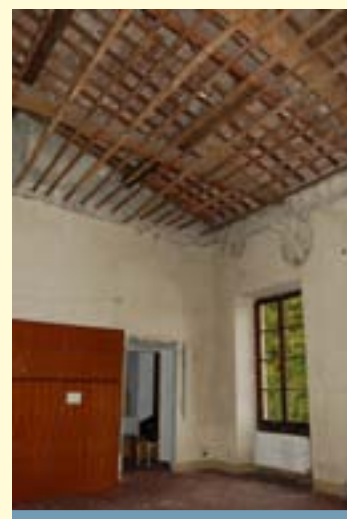
... d'autres se sont déjà effondrés !