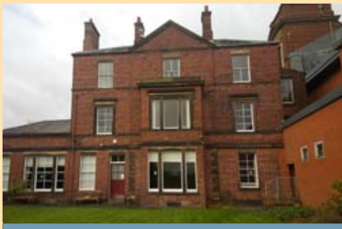
La Maison Saint-Augustin vue depuis le jardin