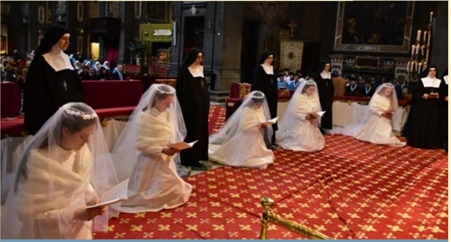
Les futures épouses du Christ, agenouillées dans le sanctuaire, expriment leur souhait de vivre dans la Maison du Seigneur au service du divin Maître.