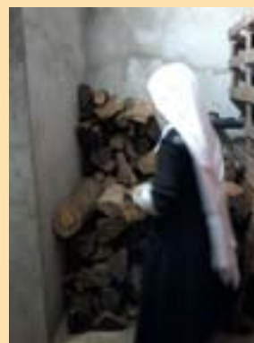
Les sœurs constituent un stock de bois

D epuis 2007, la Maison du Cœur-Royal, qui est aujourd'hui le noviciat de vos sœurs Adoratrices, est en travaux. Nous essayons, la divine Providence aidant, de la restaurer petit à petit.