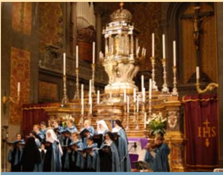
21 décembre 2017 : Concert de Noël des sœurs Adoratrices enregistré dans l'église Saints-Michel-et-Gaétan à Florence.

Cette année encore, le noviciat des sœurs Adoratrices a offert aux fidèles de notre église Saints-Michel-et-Gaétan à Florence, un concert de chants traditionnels de Noël.