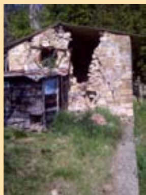
État initial du bâtiment