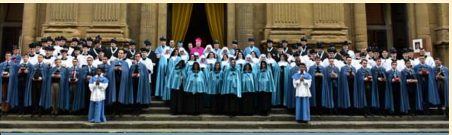
Photo de famille sur le parvis après la Messe pontificale, avec une partie des chanoines et des séminaristes, et une partie de la communauté des sœurs Adoratrices.