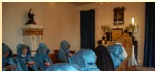
Messe votive de saint Joseph offerte pour nos bienfaiteurs dans la chapelle du noviciat

ADORATRICES DU CŒUR ROYAL DE JÉSUS-CHRIST SOUVERAIN PRÊTRE Villa du Cœur Royal Via di Gricigliano, 52 I - 50065 Sieti (FI) - Italie www.adoratrices.icrsp.org adoratrices@icrsp.org