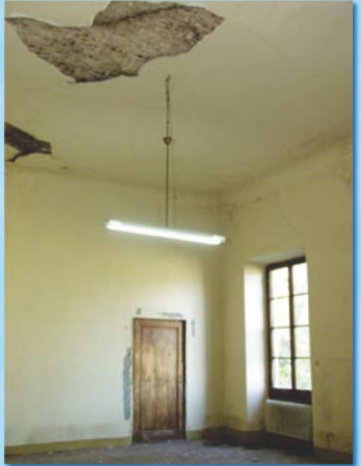
Les plafonds effondrés !