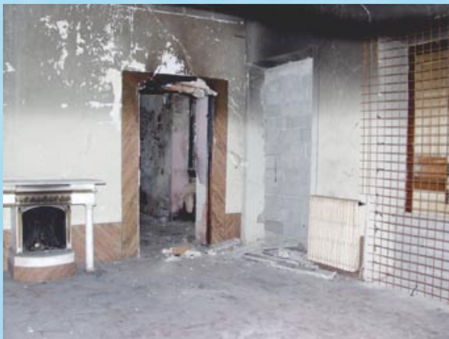
Une vue du futur réfectoire qui mérite quelques aménagements....