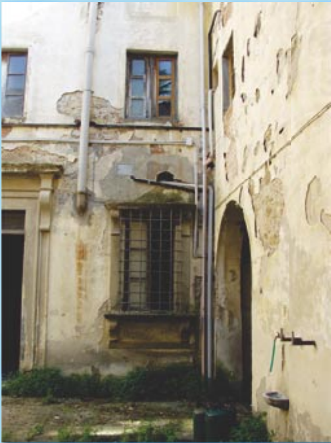
La cour intérieure délabrée !